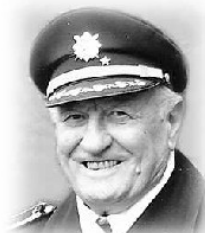
Smrť není zlé, když jí předejde dobrý život